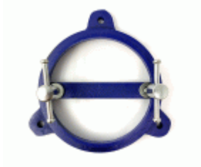
Base giratoria para tornillo de banco